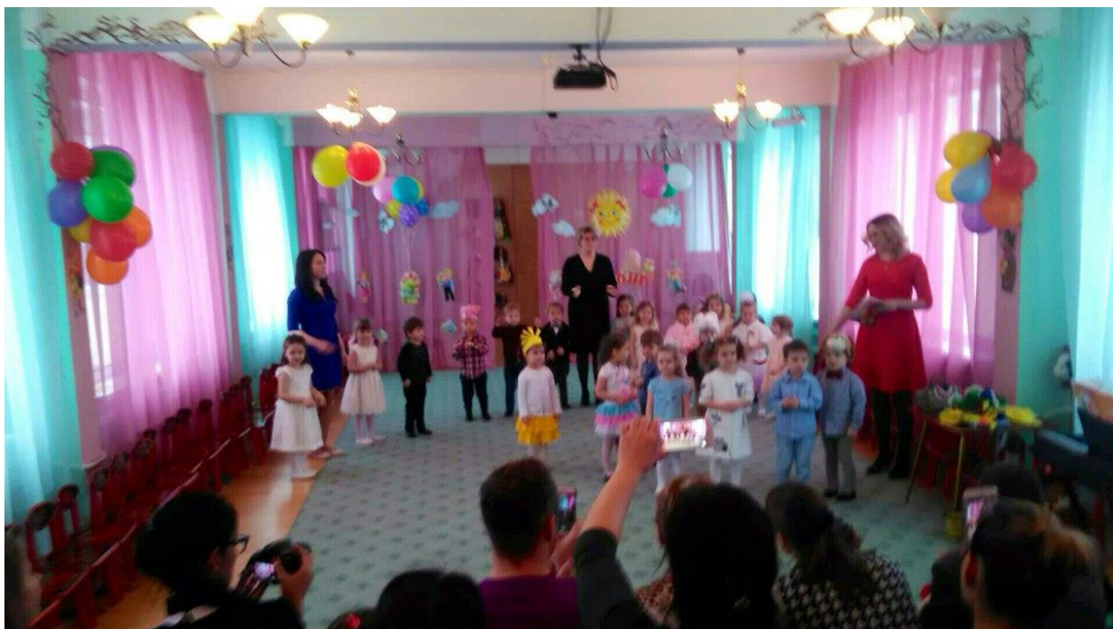
Самые талантливые артисты нашего детского сада!