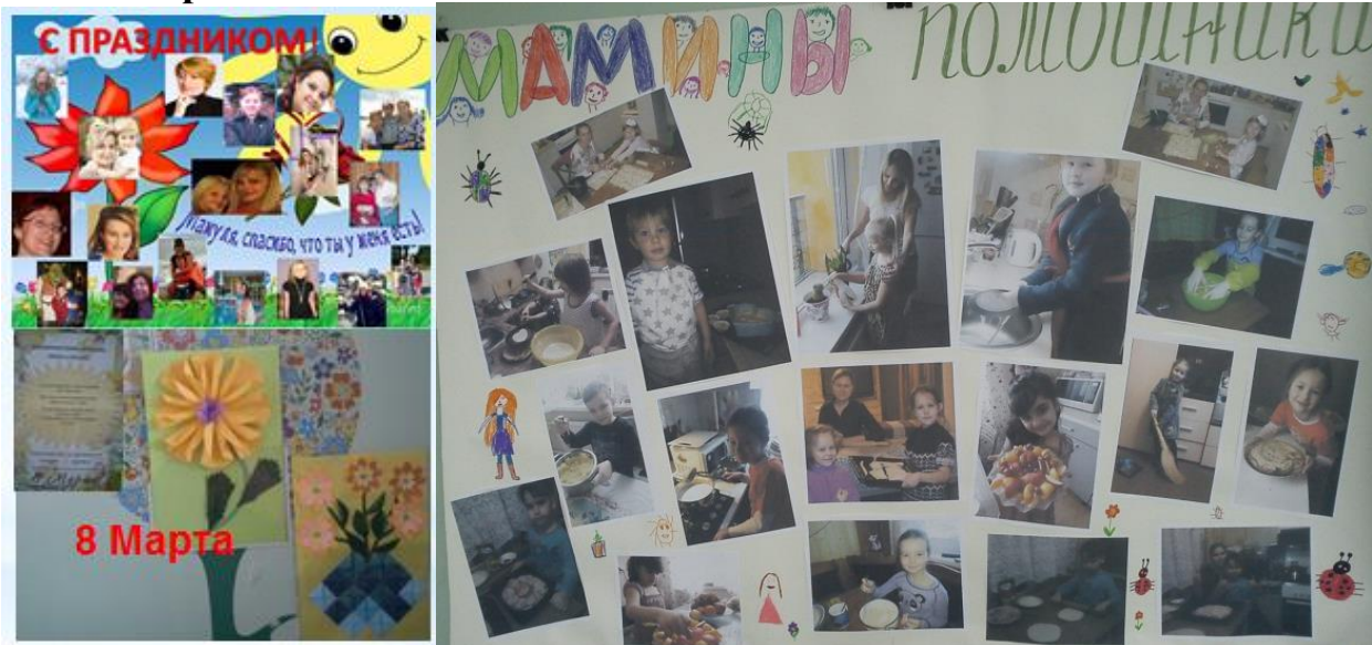
Оформили стенд для мам к 8 марта.

В марте в нашей группе был реализован проект «Сердце матери лучше солнца греет»