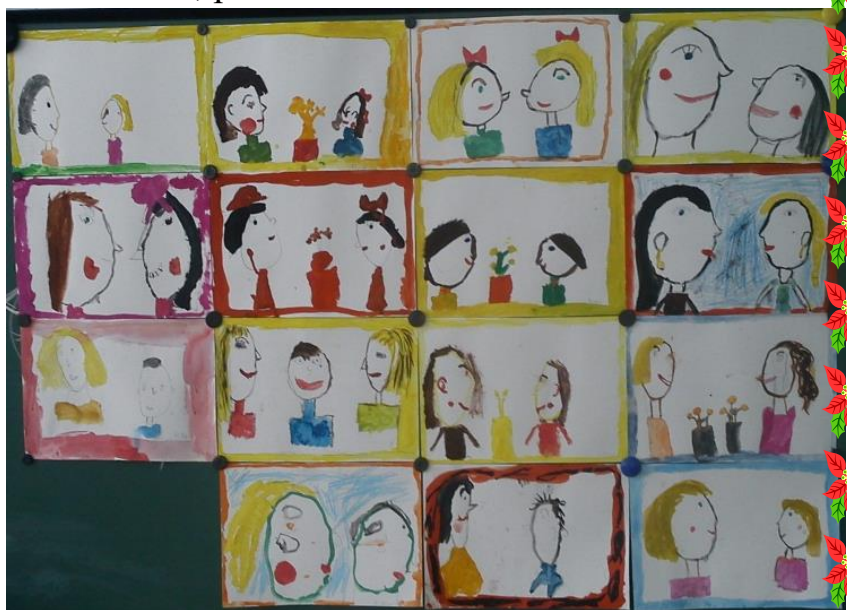
портрет «Мы с мамой улыбаемся»

Итогом работы по проекту был праздник «В стране веселых бабушек и озорных внучат». Ребята торжественно поздравляли мам, пели и танцевали для них, весело и задорно играли с бабушками, гордо демонстрировали наряды из бабушкиного сундука. Праздник удался!